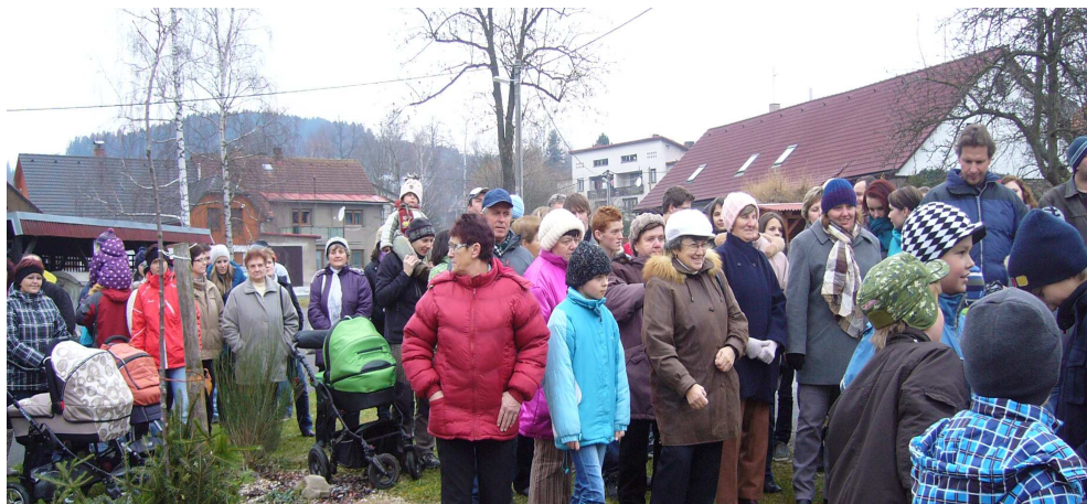
Z vánoční výstavy